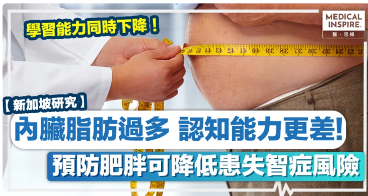
肥胖問題 | 最新研究：內臟脂肪過多會令認知能力更差！預防肥胖可降低患失智症風險

肥胖問題 | 據衛生署最新調查發現，本港超重和肥胖的人口比率為54.6%，超過35%人出現「中央肥胖」。肥胖除了會引發許多健康問題外，最新的新加坡研究發現，內臟脂肪過多的亞洲人，認知能力更差！