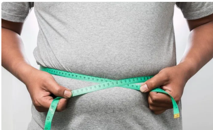
內臟脂肪過多認知能力更差！

肥胖會增加患上一些慢性疾病的風險，包括高血壓、心臟病及糖尿病等。據新加坡南洋理工大學李光前醫學院的研究顯示，亞洲人內臟脂肪過多，會影響認知及學習能力。研究使用了由2018年至2021年共收集到8,769名參加者的數據作分析，其年齡介乎於30至84歲。通過一系列的認知測試，身體檢查以及不同的評估，發現有3個參數：較低的高密度脂蛋白、較高的內臟脂肪指數和腰臀比，都會導致較低的認知能力。